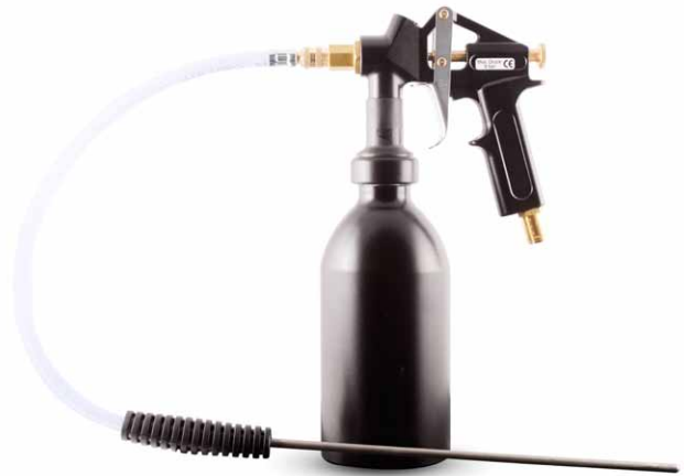
Spuitpistool met spuitlans voor rechtstreeks sproeien