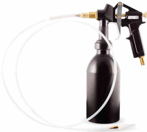
J02250 | JLM Diesel DPF Cleaning Toolkit