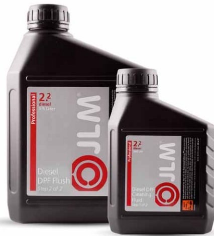
J02230 | JLM Diesel DPF Cleaning & Flush Fluidpack