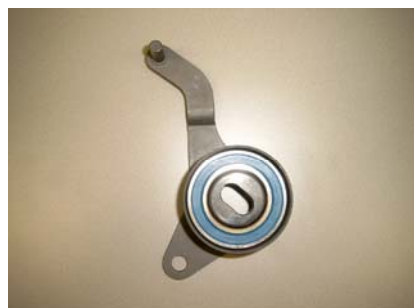
Fig. 1A OE ref. 5636724

Fig. 1b toont hoe de basisplaat van de oude spanrol geplaatst is onder het onderste “been” van de motorsteun. De nieuwe spanrol heeft niet zo’n plaat.