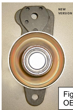
Fig. 2 OE ref. 7700871169